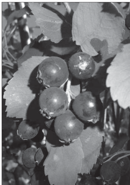
Рис. 2. Amelanchier alnifolia у період плодоношення Fig. 2. Amelanchier alnifolia in the period of fruiting

травня. У двох видів ірги ( A. alnifolia , A. florida ) квітки запахні, тому їх декоративність ми оцінили найвищим балом ( a_3 = 5 ), у решти видів — високим ( a_3 = 4 ).