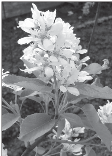
Рис. 1. Китиця ірги

Листки відіграють провідну роль у формуванні загального декоративного вигляду рослин. Оскільки представники роду Amelanchier листопадні кущі, то протягом 5 місяців року (з листопада до березня) декоративність листків не оцінювали через їх відсутність. З квітня до серпня за цією ознакою всі досліджувані види отримали найвищий бал ( a_2 = 5 ), оскільки вони належать до деревних порід, листки яких рано розпускаються і пізно опадають, тобто довговічні; мають розвинені листки нижньої, середньої та верхньої формації, декоративний ефект яких виявляється до початку та під час цвітіння через наявність густого опушення, згодом — літнім та осіннім забарвленням у різні відтінки зеленого, жовтого, помаранчевого та червоного кольорів. Протягом вересня—жовтня у A. alnifolia , A. asiatica , A. florida , A. ovalis та A. spicata оцінка декоративності листків була знижена до високої ( a_2 = 4 ), оскільки